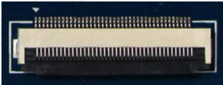
图 7 CON2 接口（40pin FFC 连接器，背面）